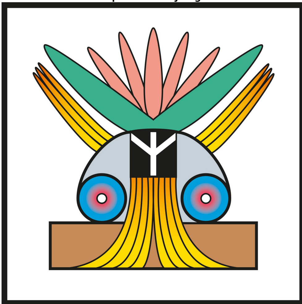
Symbol nauki energii Stwórczości <Pokój>

Tłumaczenie: 20250822 Maciej Malusi, Maria Friedel